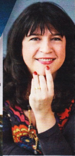
Författarinnan E.L. James.